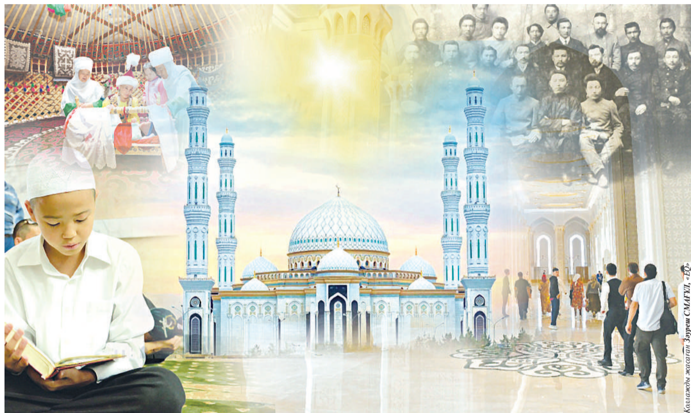
Қазақстан Республикасының Президентінің Жарлығымен